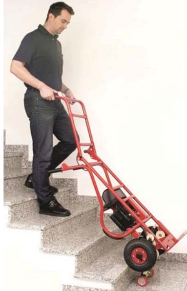
Für niedrige Lasten z.B. Waschmaschinen