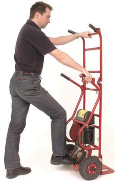
Zum leichteren Anheben von schweren Lasten Fuß auf nach hinten gefahrene Stützradachse stellen!