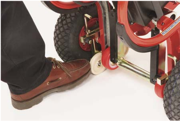
Hinteres Laufrad der Bremse nach vorne drücken