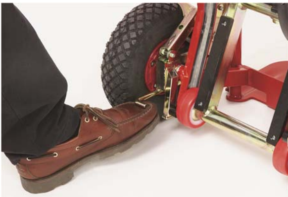
Mit Fuß oder Hand die Bremse in Neutralstellung bringen.