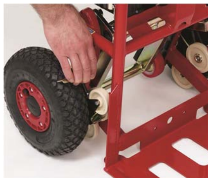
oder mit der Hand

Wichtig: Reifendruck minimal 2,5 bar wegen Bodenfreilauf.