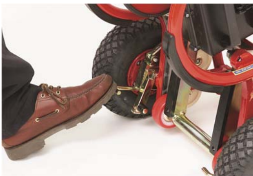
Mit dem Fuß (fest drücken)