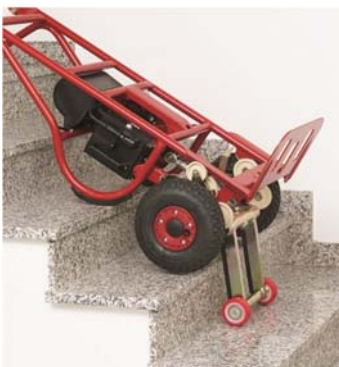
Abstellposition auf der Stiege

Durch Neigen des Rahmens kann man den Punkt des Gleichgewichts ändern. Achten Sie darauf, dass beim Neigen des Rahmens auch der Arbeitswinkel des Hebesystems verändert wird. Dadurch wird die maximale Stufenhöhe kleiner. Das ist auch dann wichtig, wenn man selbst bereits auf dem Treppenabsatz steht und die Karre noch die letzten Stufen bis zum Absatz schaffen muss.