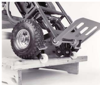
LIFTKAR gebremst auf der Stufenkante