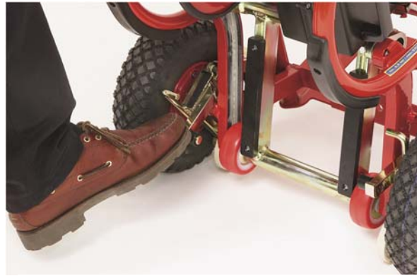
Mit dem Fuß weiter drehen bis zum Neutralstand (bei Neutralstand ruht das mittlere Rad gegen eine Nocke am Rahmen. Der Brems-Haken steht frei vom Rad).