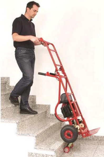
Für hohe Lasten z.B. Getränkeautomaten